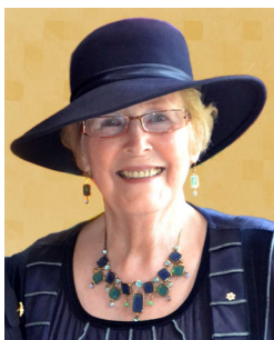
L'hon. Marion Reid

Au début des années 1990, le gouvernement a adopté une position en matière de prévention de la violence familiale qui constituait un engagement formel envers la lutte contre la violence familiale. Le travail de l'experte-conseil en matière de violence familiale, effectué en collaboration avec