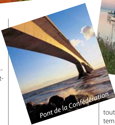
Pont de la Confédération

Visitez le lieu historique national de Port-la-Joye–Fort Amherst. Vous y découvrirez l'histoire fascinante de