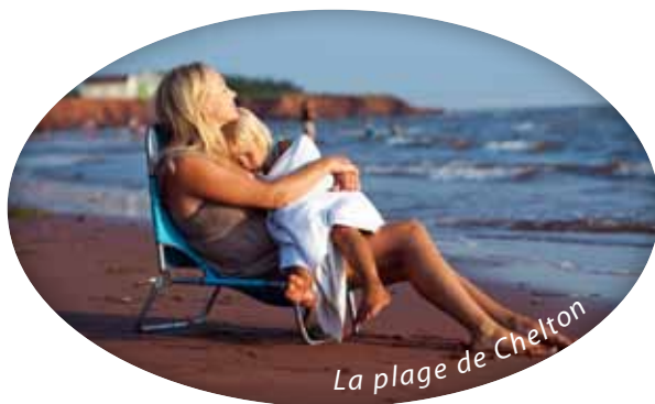
La plage de Chelton

Empruntez ensuite la route Transcanadienne en direction est. Vous aurez tôt fait d'arriver au village de Victoria-by-the-Sea qu'on dirait tout droit sorti d'un conte de fées. Historiquement, ce village était un